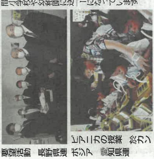
重要活動 長野県連 ボシア 愛知県連

安穩されている。公的年金制度は破綻しない ①公的年金制度が破綻すれば国は高齢者の生活を維持するため、巨額の生活保護費を全額国庫負担(税金)で負担しなければならぬ。これに対し、公的年金は加入者、企業からの年金保険料と国庫負担金双方で賄われている。②年金制度は長い制度であり、長期的に年金原資が枯渇しないように積立金を国債や