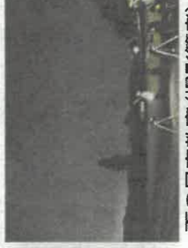
夏の星空教室

ことなどは、市原市の写真文化芸術の振興に貢献したものと信じています。 写真連盟では他に会員対象の写真研修会の実施、地域新聞への写真と記事の提供、市議会だよりへの写真提供、小湊鐵道写真展への全面的協力、内外のクラブの写真展を通しての交流、そして観光協会との連携で市のPRなどにも努めています。 私たちの活動は趣味と生かぎを原動力としており、非常に来場者が多く盛況でしたが、退会連の社会貢献活動と運動して相互に発展させていきたいと願っています。